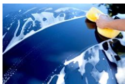
Några enkla tips vid tvätt

I vikingen finns en tvättplats belägen i garaget nedre plan. Alla kan använda den. Det kostar 50 kr för 30 minuter.