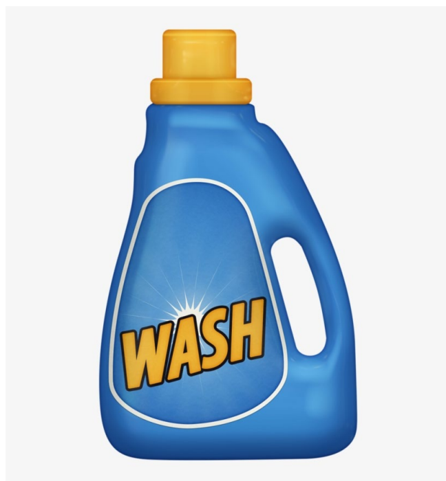
Flytande tvättmedel, liquid detergent

The water in our taps is soft and you should dose after this, see instructions on your detergent bottle.